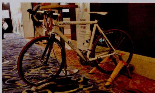
Dialog 的 SmartBond™ DA14580 蓝牙智能芯片 应用于 Cateye 公司的 Strada 智能码表