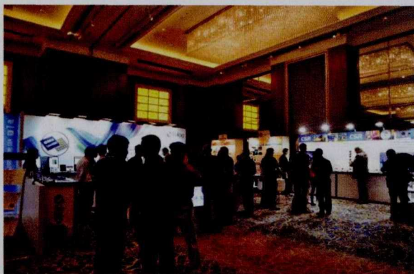
参会者参观参展商的最新技术与应用