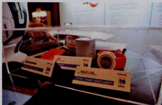
北欧半导体的蓝牙芯片在终端设备中的应用展示: 联想无线鼠标、SK 电信 Air Cube、Magellan Echo 智能运动手表

大会还带来了蓝牙技术联盟成员公司的创新成果,展示了这些技术在目前市场上的电子产品中的应用现况。